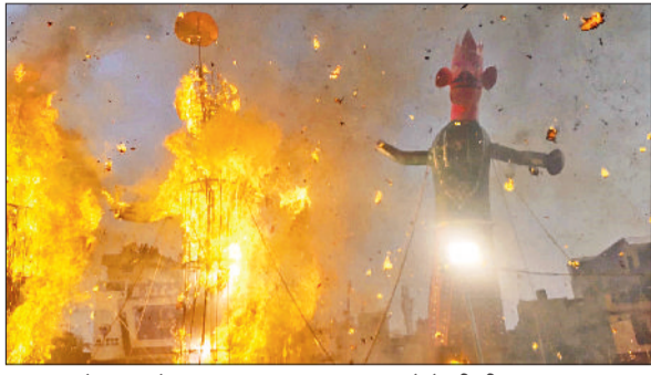
अंबाला। सेक्टर 8 में पुतला दहन का दृश्य व जमा लोगों की भीड़।

आतिशबाजी से सजा विशाल पुतला धू-धू कर जला और पूरा मैदान जय श्रीराम के नारों से गूंज उठा