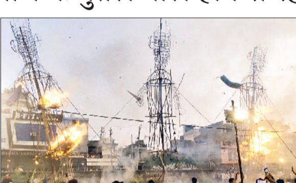
अंबाला। बरसात में पुतले दहन का दृश्य।