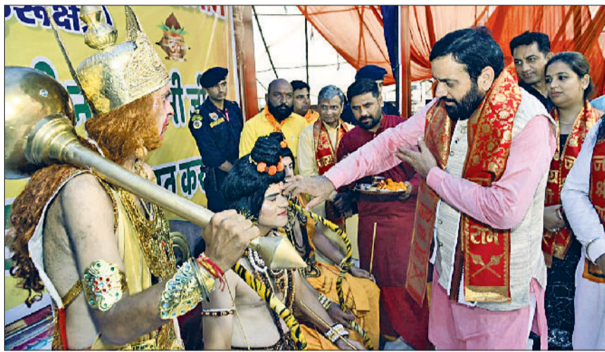
कुरुक्षेत्र। श्रीराम का तिलक करते मुख्यमंत्री नायब सिंह सैनी।

इस पावन पर्व पर हम सभी को संकल्प लेना चाहिए कि अपने जीवन से बुराइयों को दूर करेंगे और समाज में अच्छाई, भाईचारे व प्रेम का संदेश फैलाएंगे : सैनी