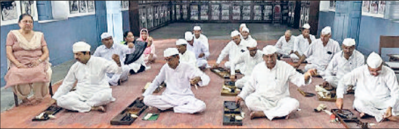
पानीपत। खादी आश्रम में बापू व लाल बहादुर शास्त्री को जयंती पर चरखा कात कर श्रद्धांजलि देते हुए गांधीवादी।