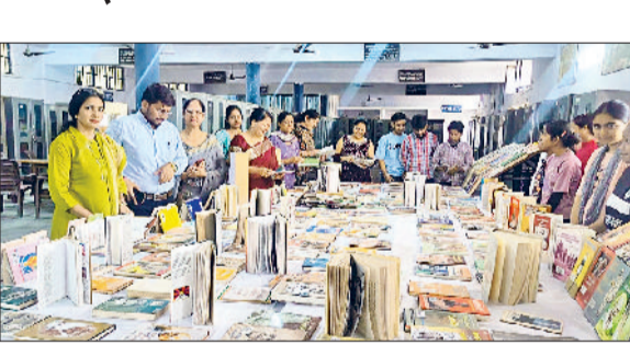
अंबाला। बुक प्रदर्शनी के दौरान शिक्षक व छात्र।

महात्मा गांधी और भारतीय स्वतंत्रता संग्राम से संबंधित पुस्तकों के साथ-साथ दुर्लभ एवं मूल्यवान संग्रह, अकादमिक और संदर्भ