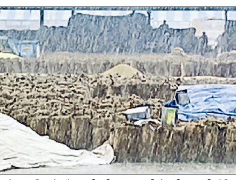
कुरुक्षेत्र। बारिश के दौरान भीगी धान की बोरियां।

वीरवार दोपहर को हुई बारिश ने किसानों के लिए परेशानी पैदा कर दी है। करीब आधा घंटा चली बारिश की वजह से अनाज मंडी में बिकने के लिए आई किसानों की धान भी भीगी गई। धान को भीगने से बचाने के लिए ठेरियों को तिरपाल से तो ढका गया, लेकिन लगातार चली बूंदबांंदी से किसानों की धान फिर भी गीली होने