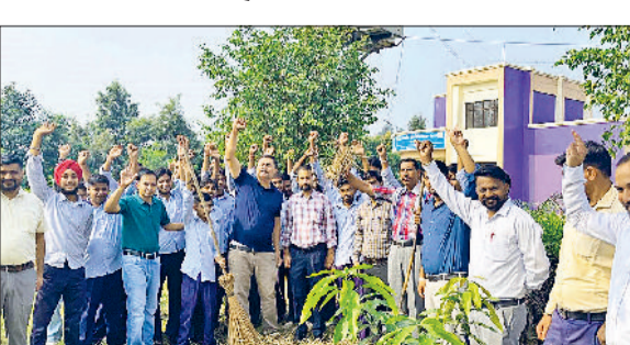
अंबाला। महात्मा गांधी की जयंती पर पौधरोपण करते छात्र व अन्य।

रहा है। हमें उनके दिखाए मार्ग पर चलकर समाज और राष्ट्र की सेवा करनी चाहिए। स्वच्छता केवल